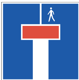
Sackgasse für den fahrenden Verkehr