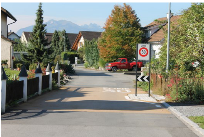
Eingang der Tempo 30 Zone im Bereich Aeueli-/Zwinghofstrasse in Diepoldsau

Die Tempo 30 Zonen werden mit einfachen Elementen einheitlich gestaltet. An den Eingängen der Zonen wird der Belag ocker eingefärbt und auf 1,20 Meter mit 6 Zentimetern leicht erhöht. Als verkehrsberuhigende Elemente sind Poller mit Rückstrahlern und Bäume sowie durch kleine gepflasterte, leicht erhöhte und etwa einen Meter in die Strasse ragende Felder vorgesehen.